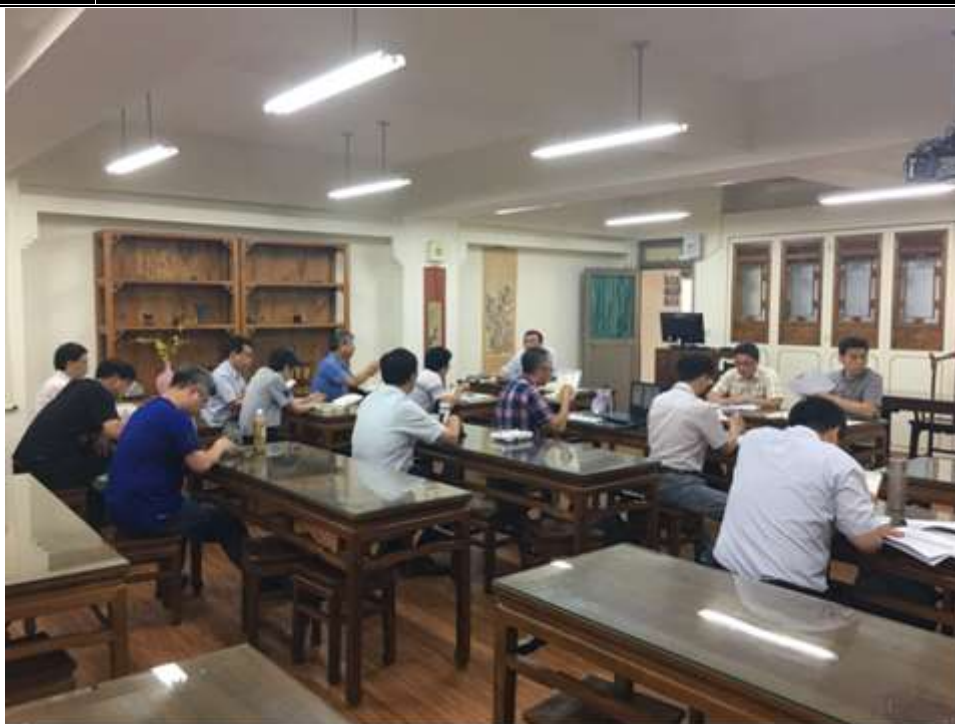
照片 2 說明